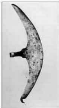
Ratna sjekira "bardiš", Rusija 17 vijek.

Tipološki znatno drukčija je bardiš sjekira iz muzejske zbirke (inven. broj 1080/348). Ima relativno dugo sječivo (50,5x8,4 cm) iste polumjesečaste forme čiji se donji krak savija i poprima formu spljoštene pločice sa otvorom za prikivanje na motku. Sječivo se po sredini sužava i prelazi u mali višestрани tulac.