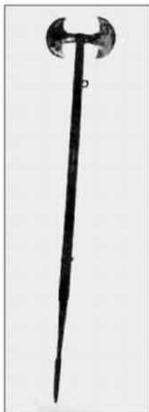
Derviška sjekira, Turska 17 vijek