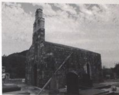
Prilog 8 Crkva Sv. Gospe, izgled u toku

Na osnovu stila jednog impost-kapitela nađenog u crkvi Sv. Petke kod Sozinskog tunela, Pavle Mijović je ukazao na mogućnost da je u Crmnici, moguće u blizini nalaza kapitela, bila sagrađena crkva u 11. vijeku, kada je ova oblast hristijanizirana. 34