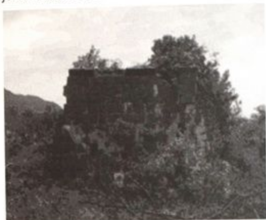
Pr.1 Crkva na Šćepan brijegu-zid, 2009.g.

treba identifikovati kao crkvu Sv. Stefana na Šćepan brijegu, sadrži podatke da se ova crkva površine osnove od oko 40 m 2 , koja je sagrađena od pritesanog kamena i krečnog maltera, prethodno nalazila na zadovoljavajućem stupnju očuvanosti, te da su u zemljotresu uništeni njen krovni pokrivač, svodovi i zidovi, tj. da je objekat najvećim dijelom bio porušen. Nakon pregleda i ocjene stanja u okviru sanacionog programa preporučena je restauracija. Preporučene mjere sanacije crkve na Šćepan brijegu nijesu realizovane i ona je do danas sačuvana u ostacima.