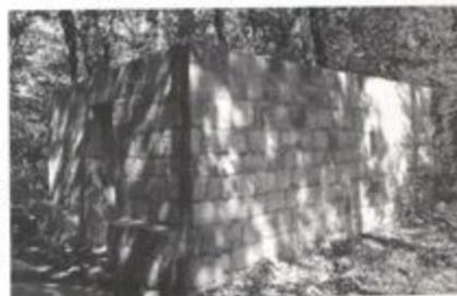
Pr. 10 Crkva Sv. Jovana Krstitelja-Dubrava,