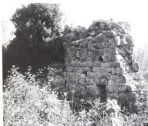
Pr.2 Crkva na Šćepan brijegu-unutrašnjost, 2011.g.