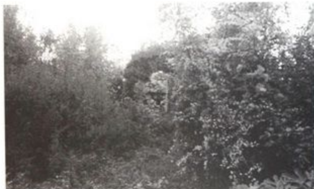
Pr. 3 Crkva na Šćepan brijegu, izgled oktobra 2016.g.

Do urušavanja crkve 1979. godine, okolno dvorište bilo je ograđeno niskim zidom od kojeg su takođe vidljivi samo ostaci. U blizini dvorišnog ulaza, u sklopu ogradnog zida nalazio se ugrađeni kameni blok sa uklesanim natpisom o njegovom nastanku 1912. godine, koji je sada smješten u dvorištu obližnje kuće. 4