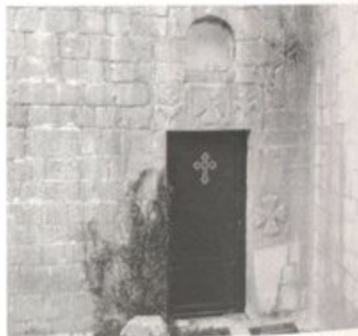
Pr. 7 Bogorodičina crkva, južni ulaz, 2012.g.

Crkva Sv. Gospođe u Gluhom Dolu (Prilog 8) koja je, prema natpisu na ploči iznad zapadnog ulaza, podignuta 1910. godine, predstavlja jednobrodnu građevinu sa polukružnom oltarskom apsidom i zvonikom-arkadom na pročelju. Nedavno je obnovljena.