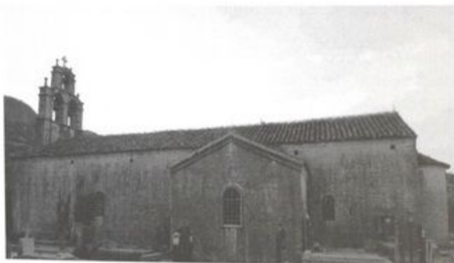
Pr. 6 Bogorodičina crkva, južna fasada, 2012.g.

Oštećenja na crkvi nastala u zemljotresu 1979. godine sanirana su početkom 90-ih godina dok su restauratorski radovi na ikonostasu završeni krajem 90-ih godina 20. vijeka. 26 Opservacijom kamenog fasadnog sloga i pojedinih elemenata reljefne plastike, posebno okvira prozora i južnog ulaza u crkvu, zapaža se više graditeljskih etapa i upotreba arhitektonske i dekorativne plastike kao spolija u nekoj od kasnijih obnova, moguće sa starijeg hrama, što je potrebno provjeriti arhitektonskim i arheološkim istraživanjima.