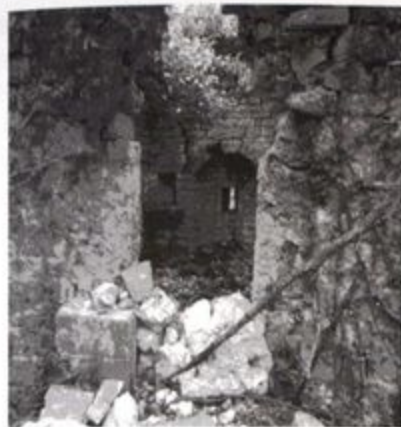
Pr. 4 Crkva Sv. Petra-pogled na unutrašnjost 2012.g.