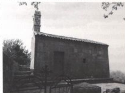
Pr. 9 Crkva Sv. Trojice-Jasen, 2012.g.