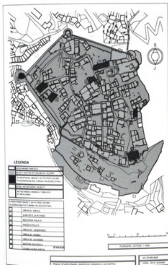
Slika 2 – Evidentirani objekti sa potencijalnim pojedinačnim kulturnim vrijednostima

Da Starom Baru tek predstoji adekvatna kulturno-turistička valorizacija svjedoči, u posljednje vrijeme, sve veća zainteresovanost za ovaj lokalitet domicilnih i inostranih eksperata iz kulture i turizma, poput poznatih svjetskih turističkih lanaca, kao što je Paradores del turismo , španski turistički brend, poznat po visoko kategorisanim hotelima upravo u kulturnim dobrima. Takođe, Ministarstvo nauke Crne Gore u saradnji sa Ministarstvom kulture i Opštinom Bar planira da u dogledno vrijeme pokrene, upravo, u Starom Baru osnivanje državne institucije - Istraživačkog centra za arheologiju i kulturno nasljeđe. Svakako, u Starom Baru ima dovoljno prostora za ove i druge diferente, a kompatibilne razvojne projekte, u skladu sa održivim razvojem destinacije/lokaliteta.