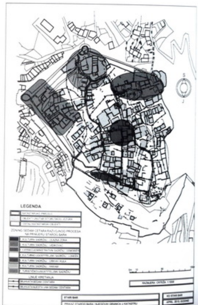
Slika 5 – Zoning sedam centara razvojnog procesa na primjeru Starog Bara