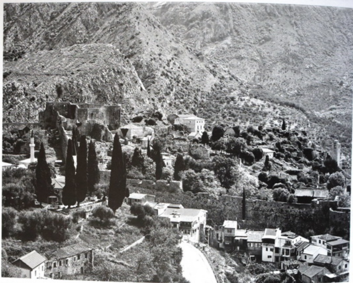
Slika 1 – Stari grad Bar, pogled sa sjevero-zapadne strane

ne čudi podatak da je sve do oslobođenja od Osmanlija, upravo, Bar, a ne Ulcinj, bio glavno pristanište Skadra 3 .